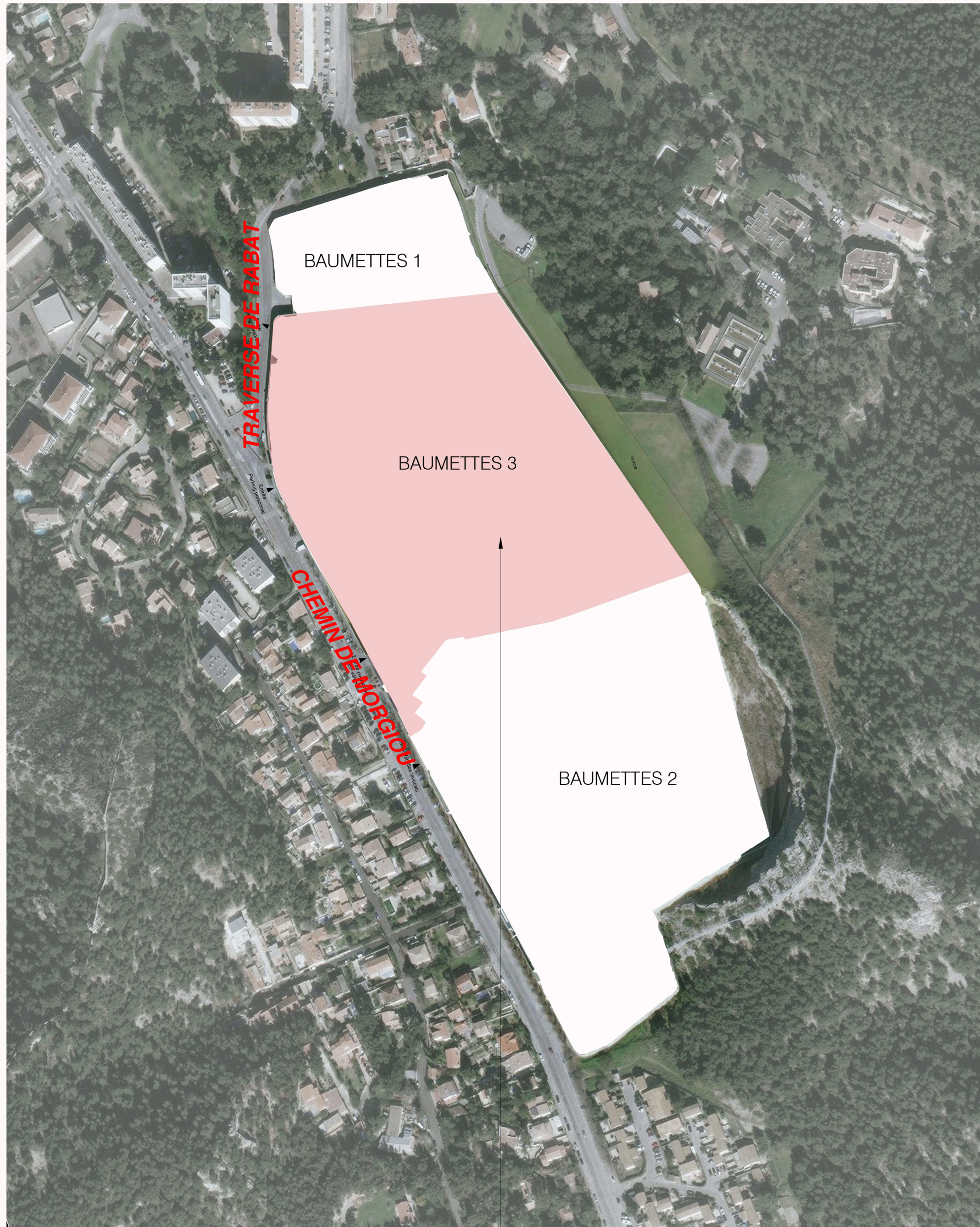
EMPRISE DU PROJET