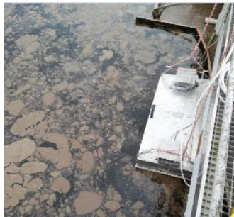
Prélèvement en chambre ventilée