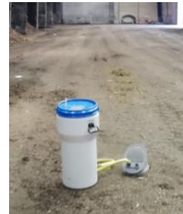
Prélèvement en ambiance