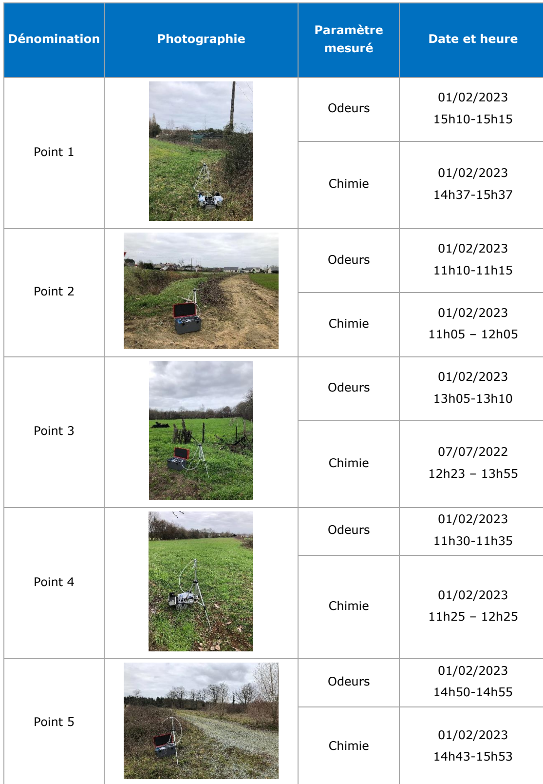
Tableau 1 : Programme d'investigation réalisé

La cartographie des odeurs a été réalisée en parallèle de la mise en œuvre des mesures physico-chimiques. Ainsi, 1 tournée a été réalisée.