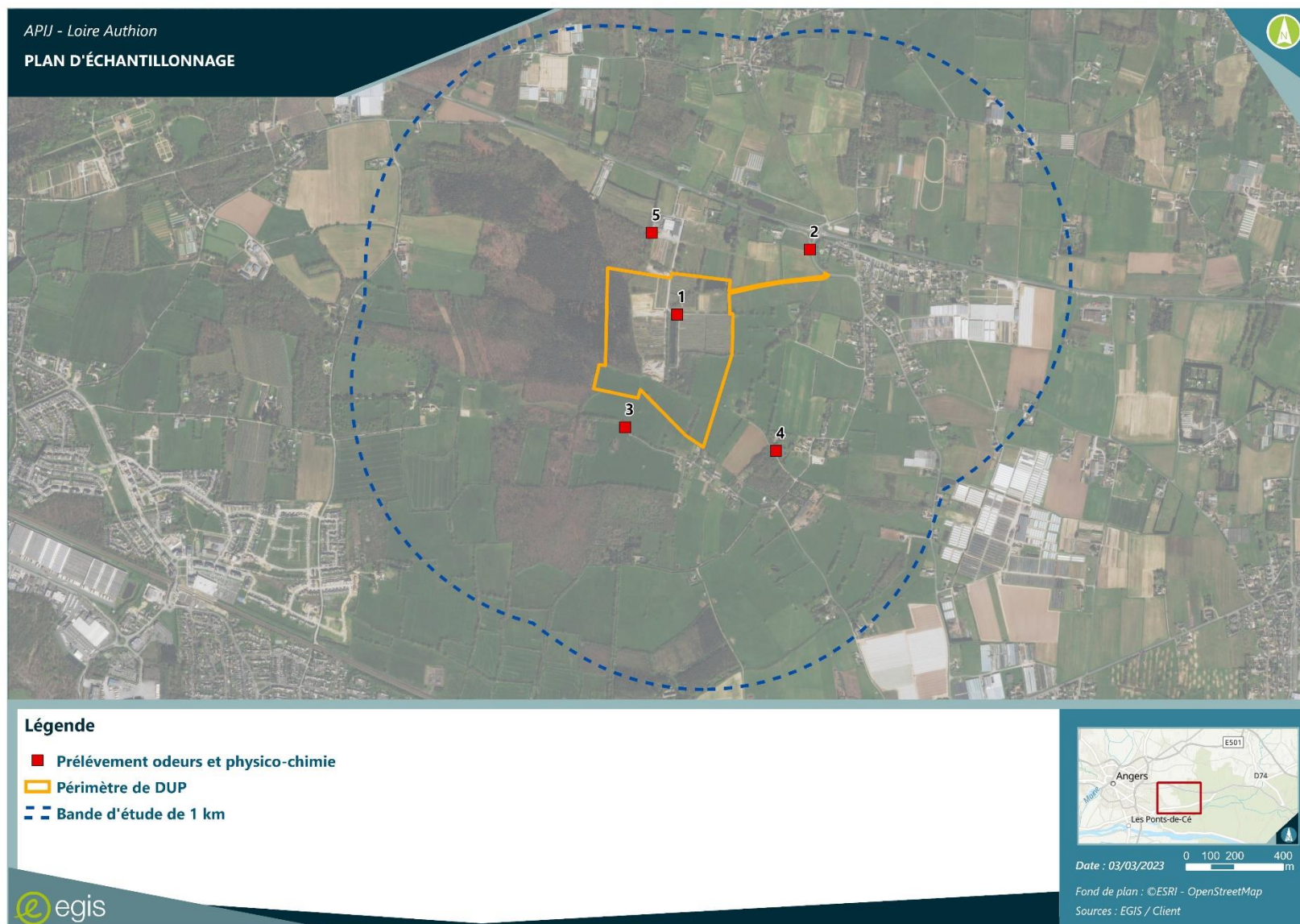
Figure 1 : Localisation des points de mesures