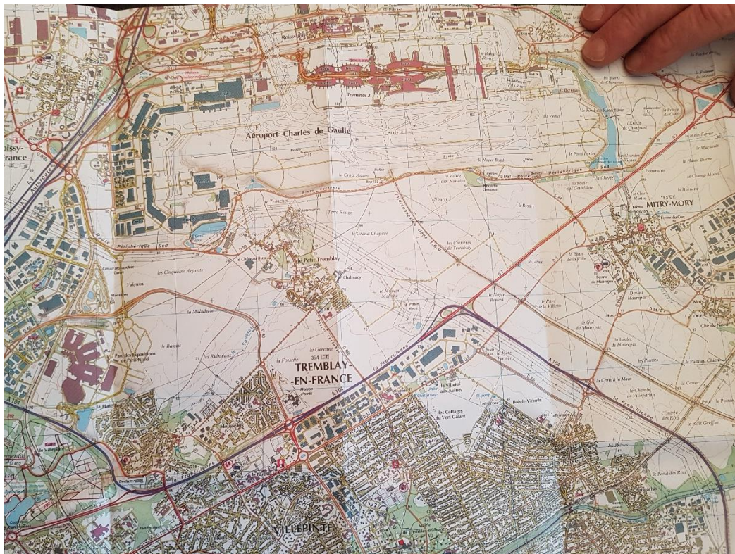
Plan masse du site