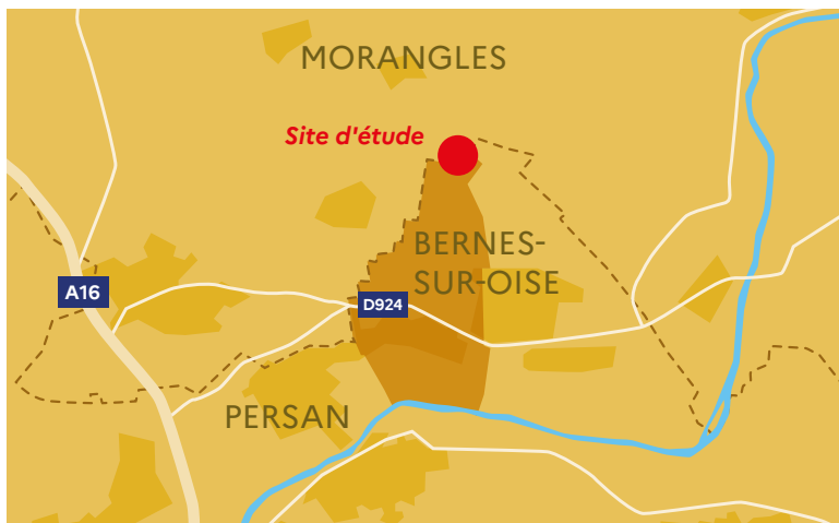
La localisation préférée du projet

Le site d'étude est localisé sur une parcelle en partie occupée par l'Agence nationale pour la formation des adultes (AFPA). Les plateaux de formation de l'AFPA, qui seraient impactés par le projet, seraient réimplantés sur les terrains qu'elle occupe à Bernes-sur-Oise ou à Morangles.