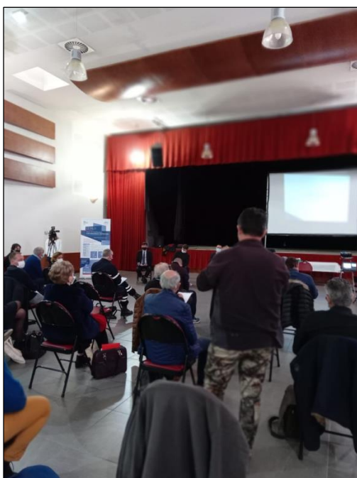
Photo échanges avec la salle