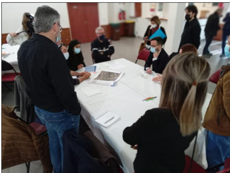
Photo travail en atelier

Les échanges étaient ouverts et constructifs. Chaque personne a pu s'exprimer et participer au projet par son expertise d'usage. Les travaux de groupe ont été suivis par une restitution devant l'ensemble des participants.