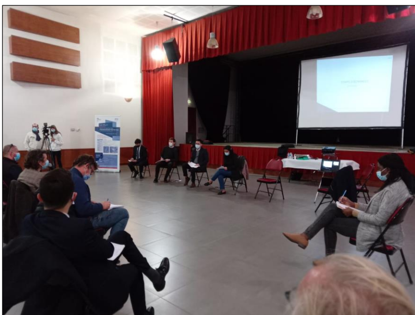
Photo réunion plénière