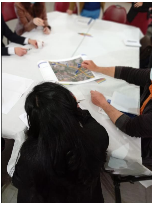
Photo travail en atelier