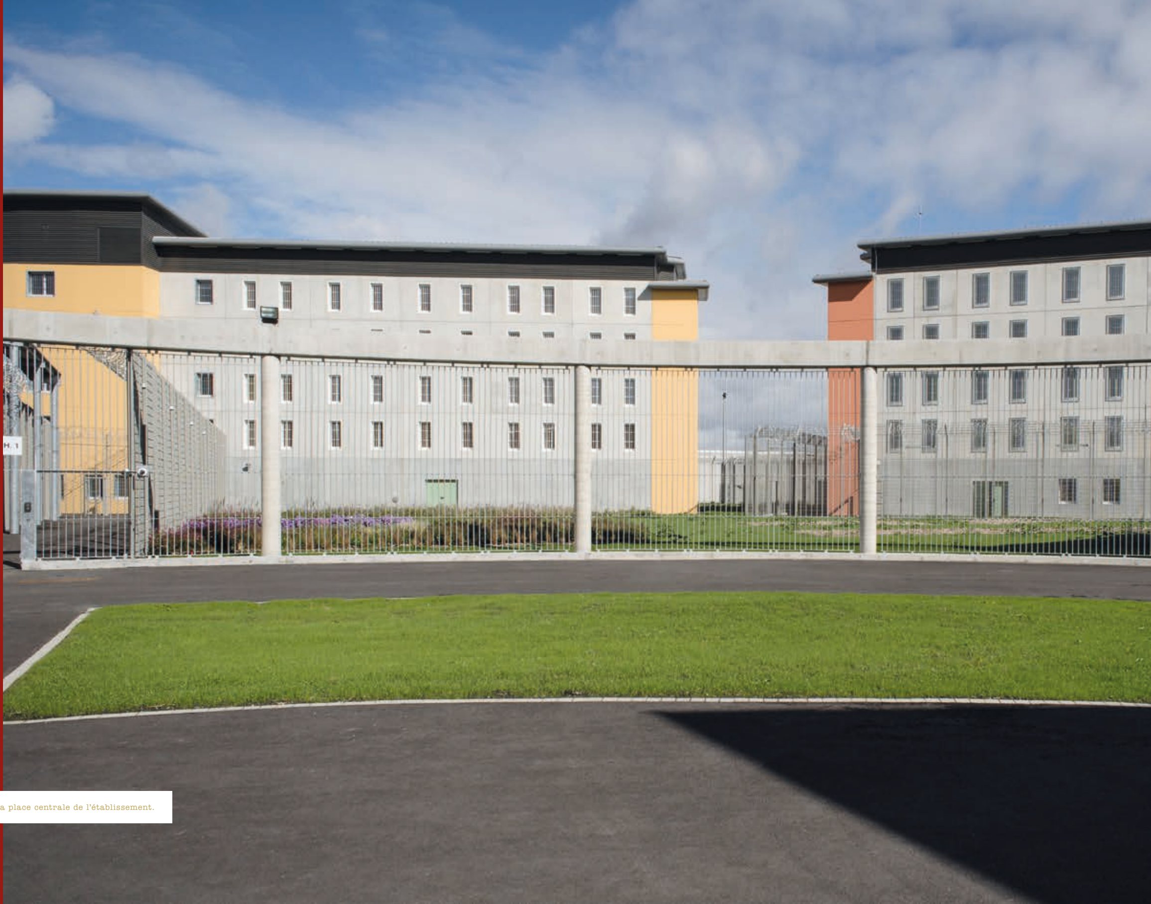
^ La place centrale de l'établissement.