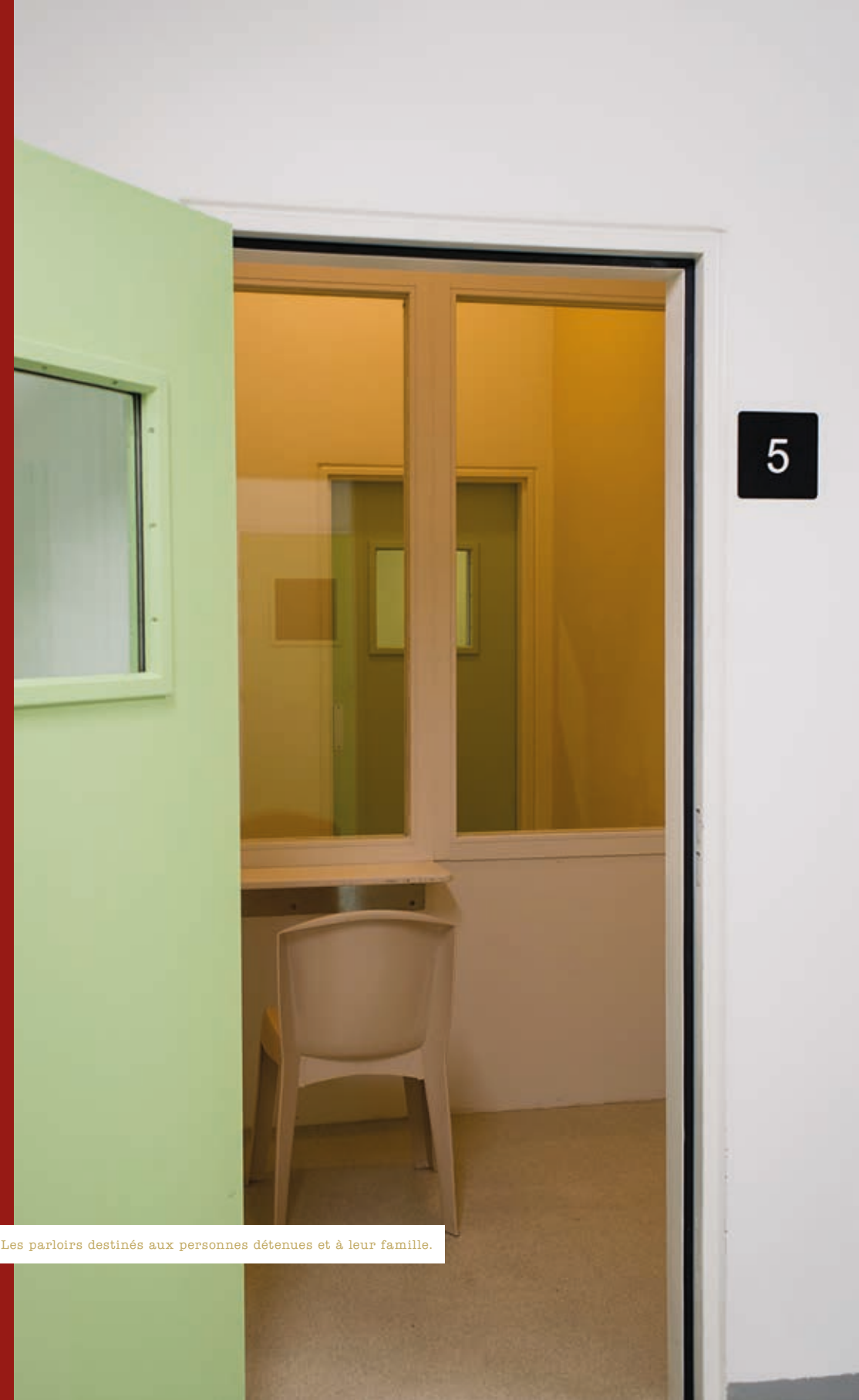
^ Les parloirs destinés aux personnes détenues et à leur famille.