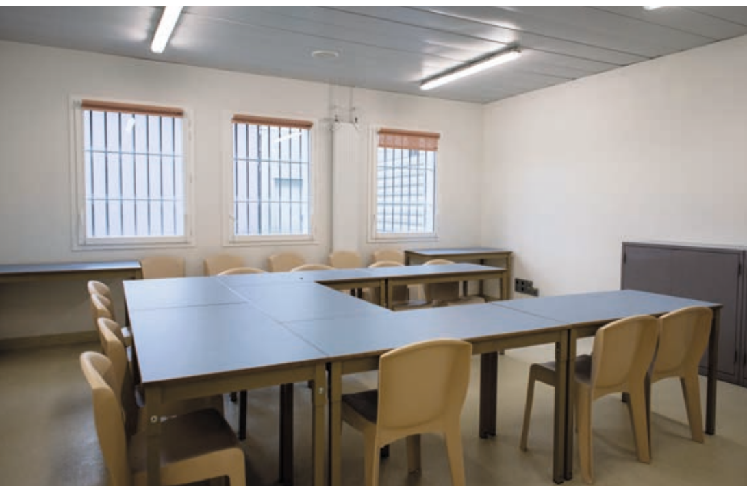
^ Une salle de formation.