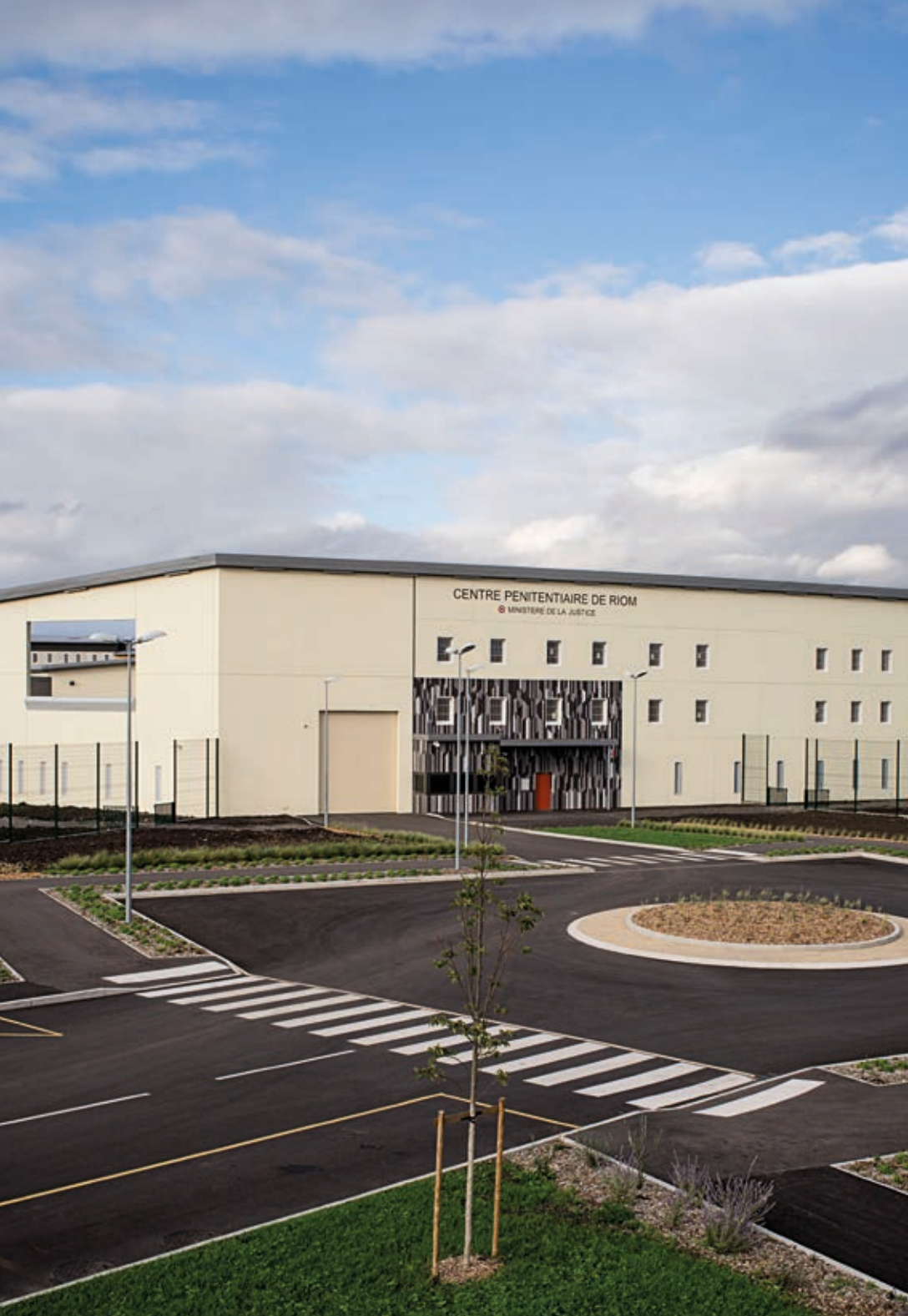
▲ Le bâtiment de l'administration est inséré dans le mur d'enceinte et rompt ainsi sa linéarité et adoucit la façade.

Situé à l'est de Riom, à proximité de la commune d'Ennezat, le nouveau centre pénitentiaire, qui a pris place dans la moitié nord du département du Puy-de-Dôme, fait pleinement partie de la périphérie de Clermont-Ferrand. Implanté sur d'anciennes terres agricoles que d'importants travaux de terrassement ont homogénéisées, cet établissement ne se trouve d'ailleurs qu'à une demi-heure en voiture de la capitale de l'Auvergne.