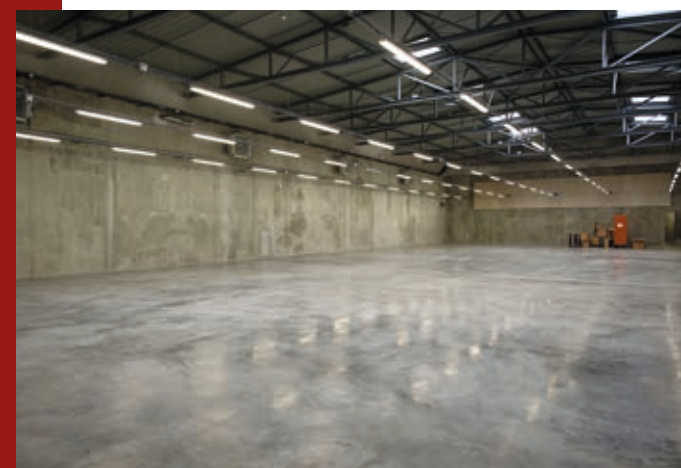
^ Les ateliers permettent aux personnes détenues de travailler.