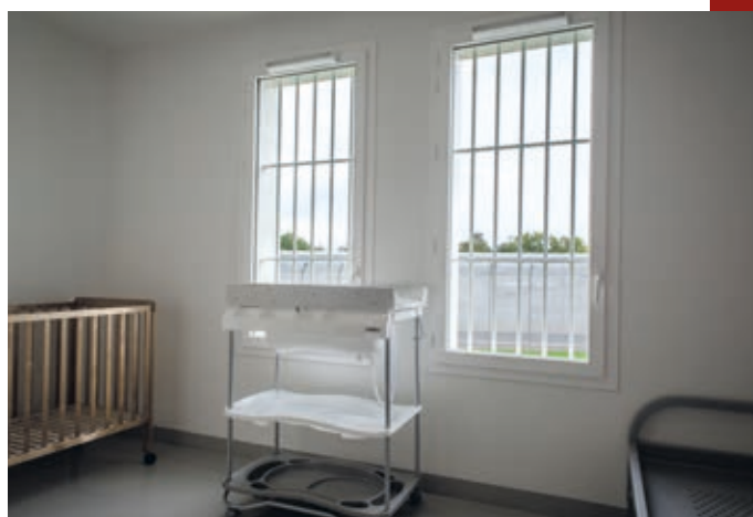
^ Une cellule du quartier nourrice au sein de la maison d'arrêt des femmes.

Parmi les spécificités des quartiers d'hébergement destinés à être gérés en régime ouvert (le CDH et la MAH1), la présence d'une salle commune, d'une cuisine et d'une laverie à chaque étage contribuera à l'autonomisation des personnes détenues.