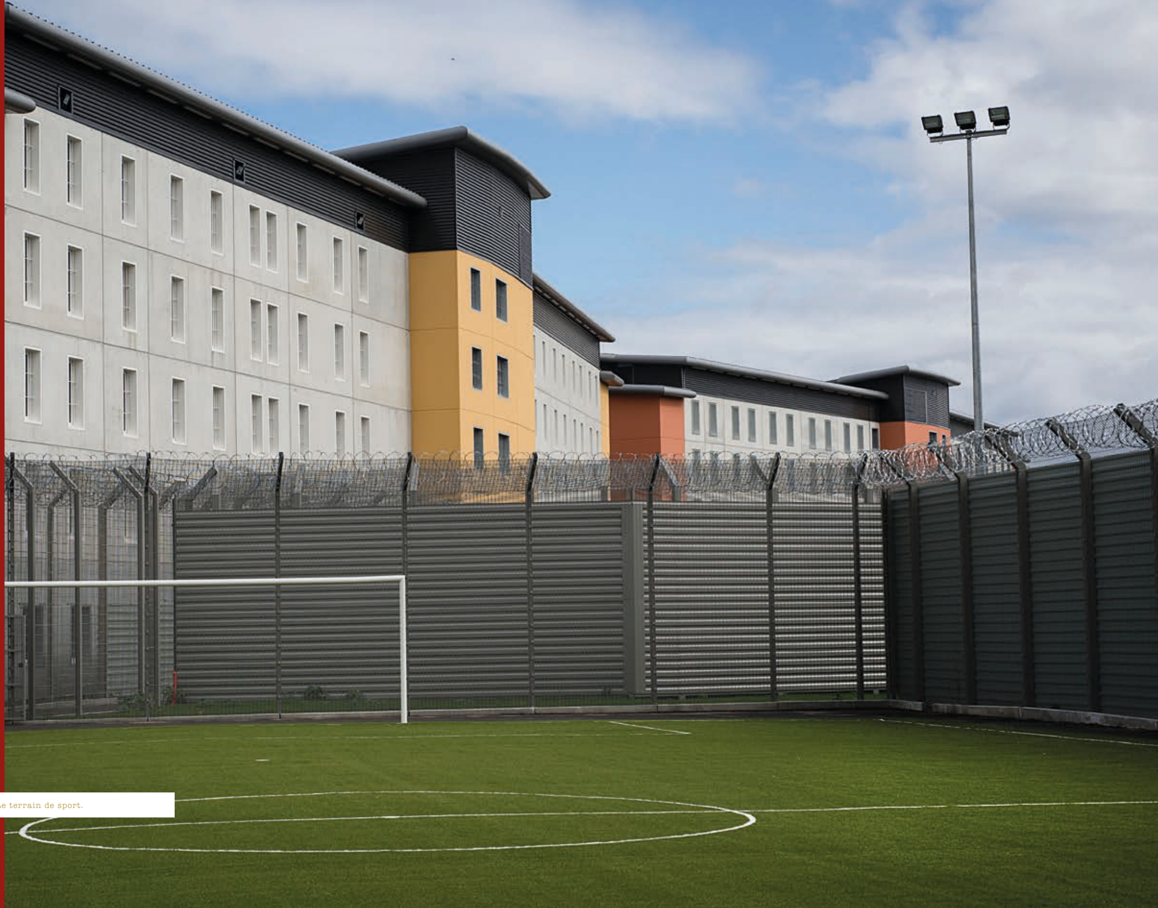
▲ Le terrain de sport.