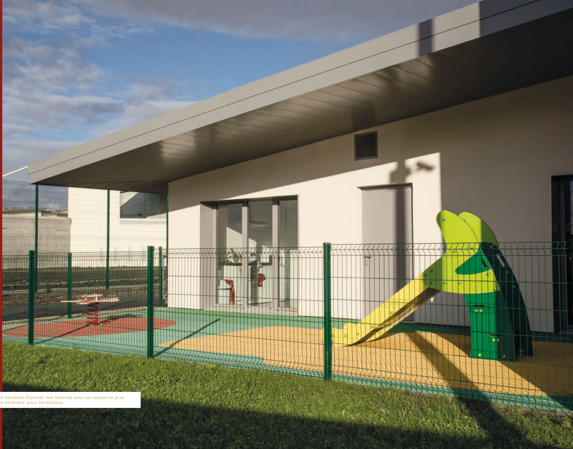
^ Le bâtiment d'accueil des familles avec un espace de jeux en extérieur pour les enfants.