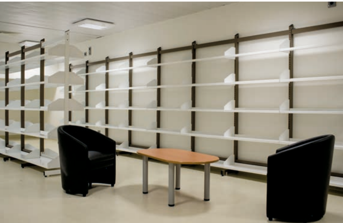
^ Une des bibliothèques.