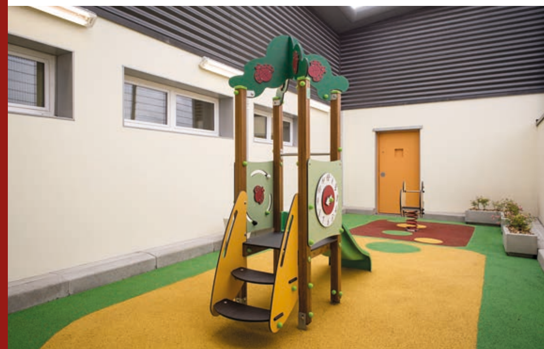
^ Une cellule du quartier d'accueil.