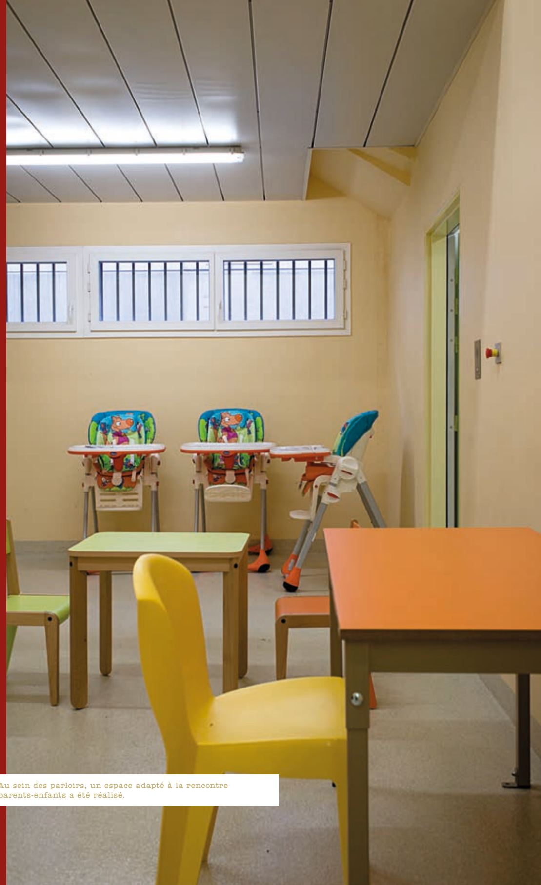
^ Au sein des parloirs, un espace adapté à la rencontre parents-enfants a été réalisé.