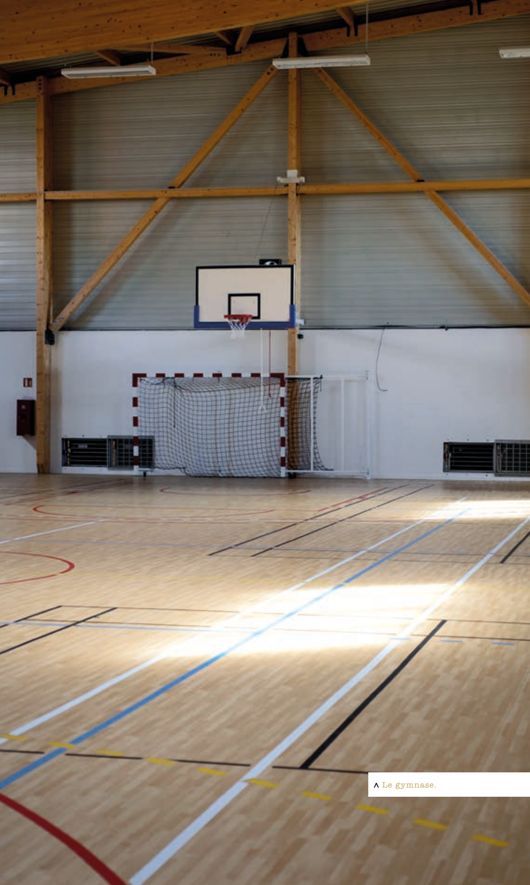
^ Le gymnase.