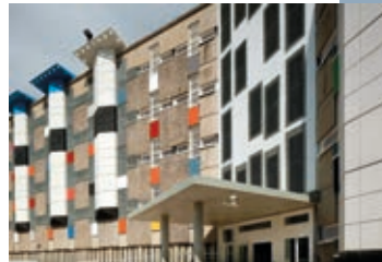
▲ La façade de la tripale D5.

Il s'agit notamment d'améliorer les conditions de travail du personnel pénitentiaire, les conditions de vie en détention et l'accueil des visiteurs.