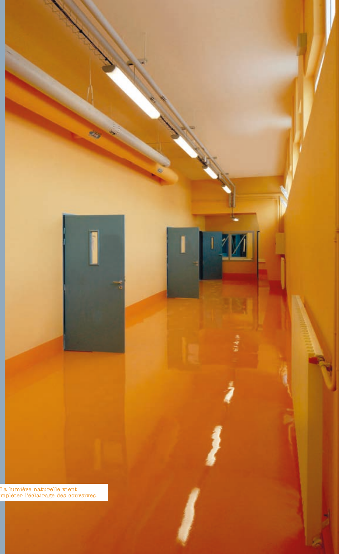
▲ La lumière naturelle vient compléter l'éclairage des coursives.