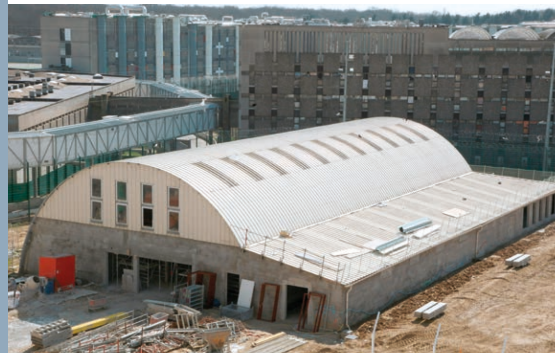
▲ L'unité de consultations et de soins ambulatoires provisoirement relogée dans le gymnase en cours de rénovation attenant à la tripale D5.