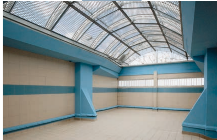
^ Une cour de promenade aérienne, spécificité de la tripale D5.

La tripale D5 a la particularité de posséder, en lien avec son quartier arrivants, des cours de promenade aériennes.