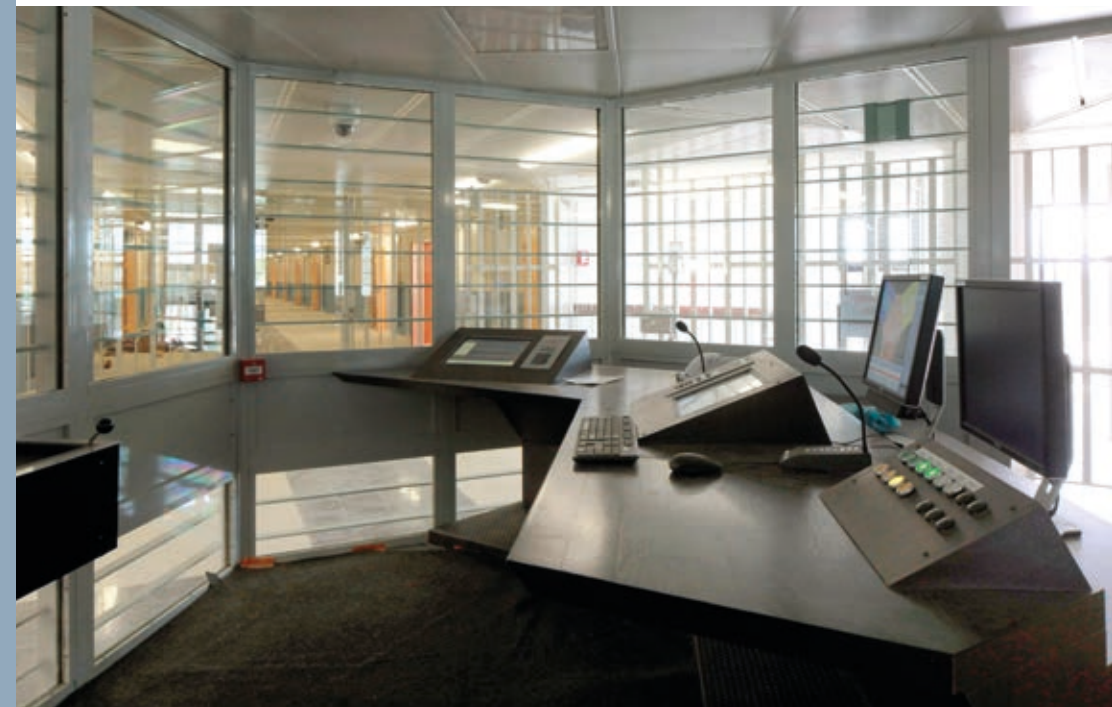
^ Des ronds-points de surveillance sont situés à chaque étage de la tripale.