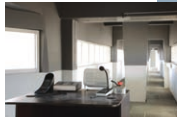
^ La passerelle de surveillance des cours de promenade.

En termes de sûreté active, les ronds-points qui occupent la jonction des trois couloirs à chaque étage de la tripale ont été équipés des derniers outils de communication et de gestion informatisée (caméra, report des alarmes, interphonie avec les cellules, contrôle des accès). Leur ergonomie