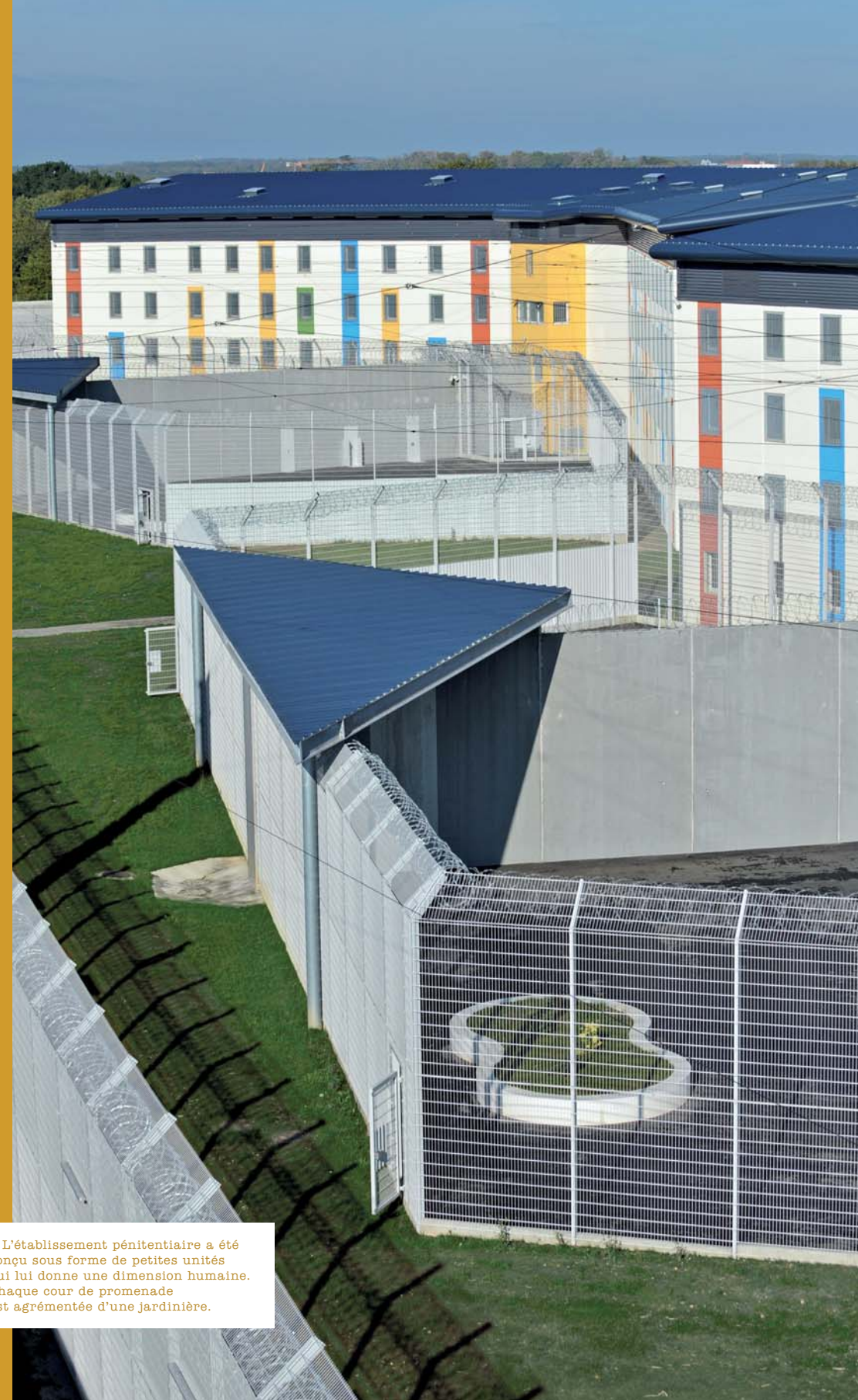
▲ L'établissement pénitentiaire a été conçu sous forme de petites unités qui lui donne une dimension humaine. Chaque cour de promenade est agrémentée d'une jardinière.