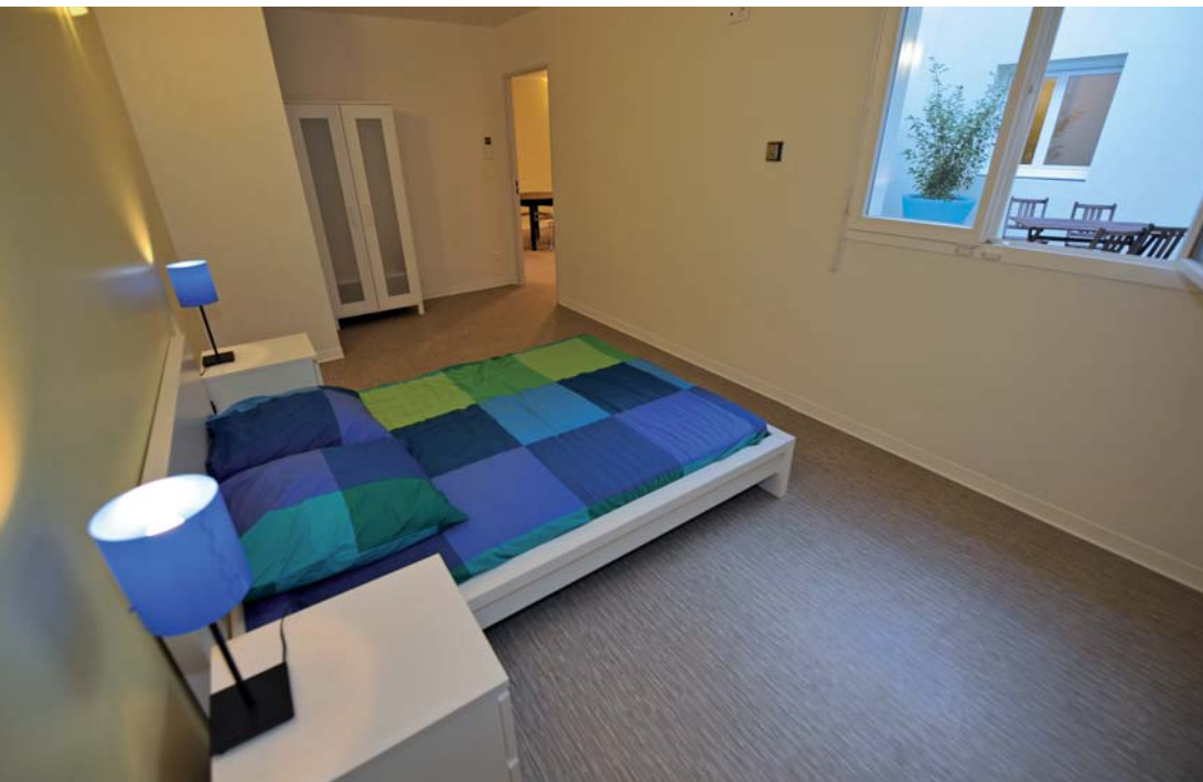
^ Une des 4 unités de vie familiale.