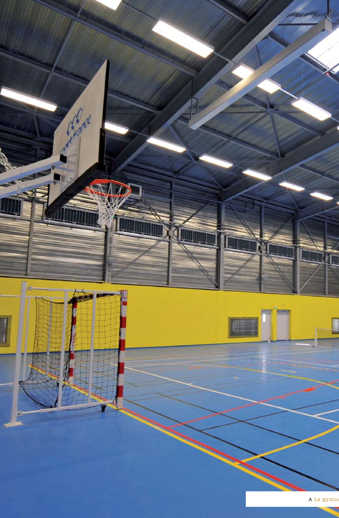
^ Le gymnase.