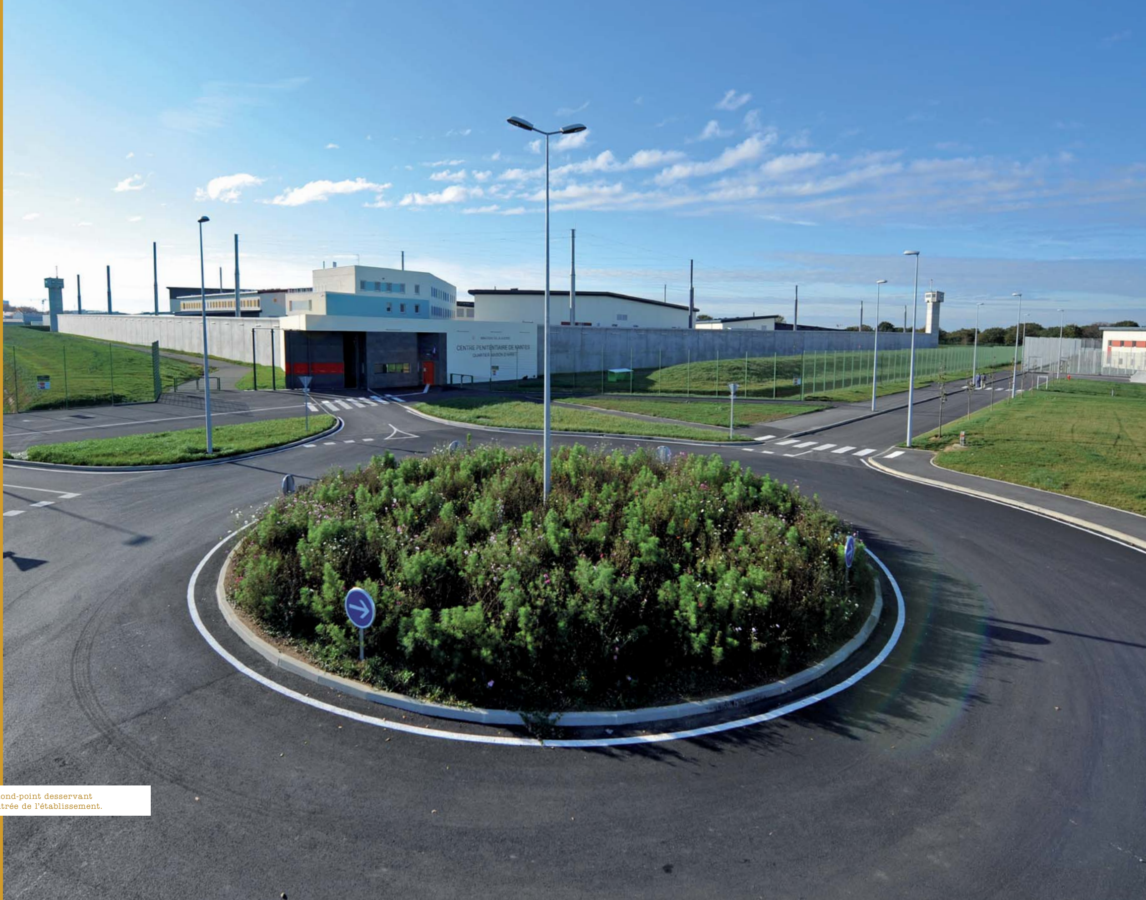
▲ Rond-point desservant l'entrée de l'établissement.