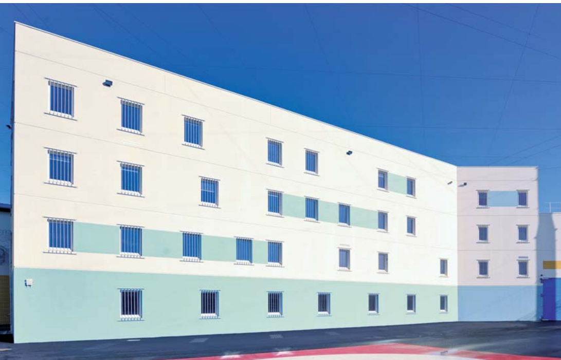
^ Vue extérieure du mess. ^ Le bâtiment dédié à l'administration.