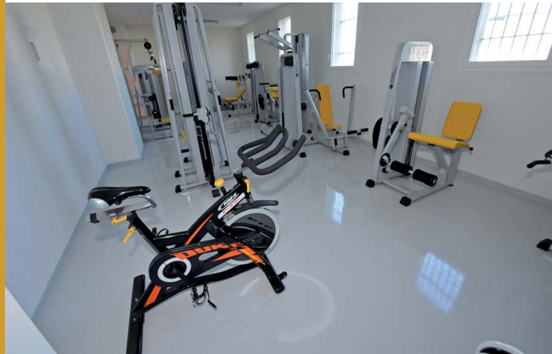
^ Une des salles de musculation. ^ Le terrain de sport.