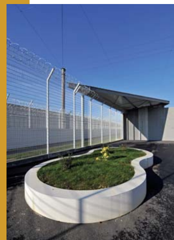
^ Une des jardinières-bancs implantées dans les cours de promenade.