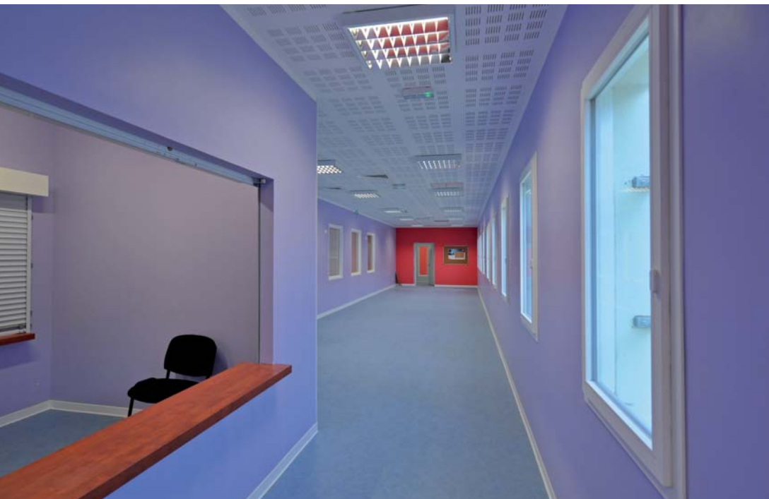
^ Extérieur du bâtiment destiné à l'accueil des familles. ^ L'accès au parloir réservé aux familles.

Le cahier des charges de la maison d'arrêt s'est montré attentif au traitement des ambiances, intérieures et extérieures.