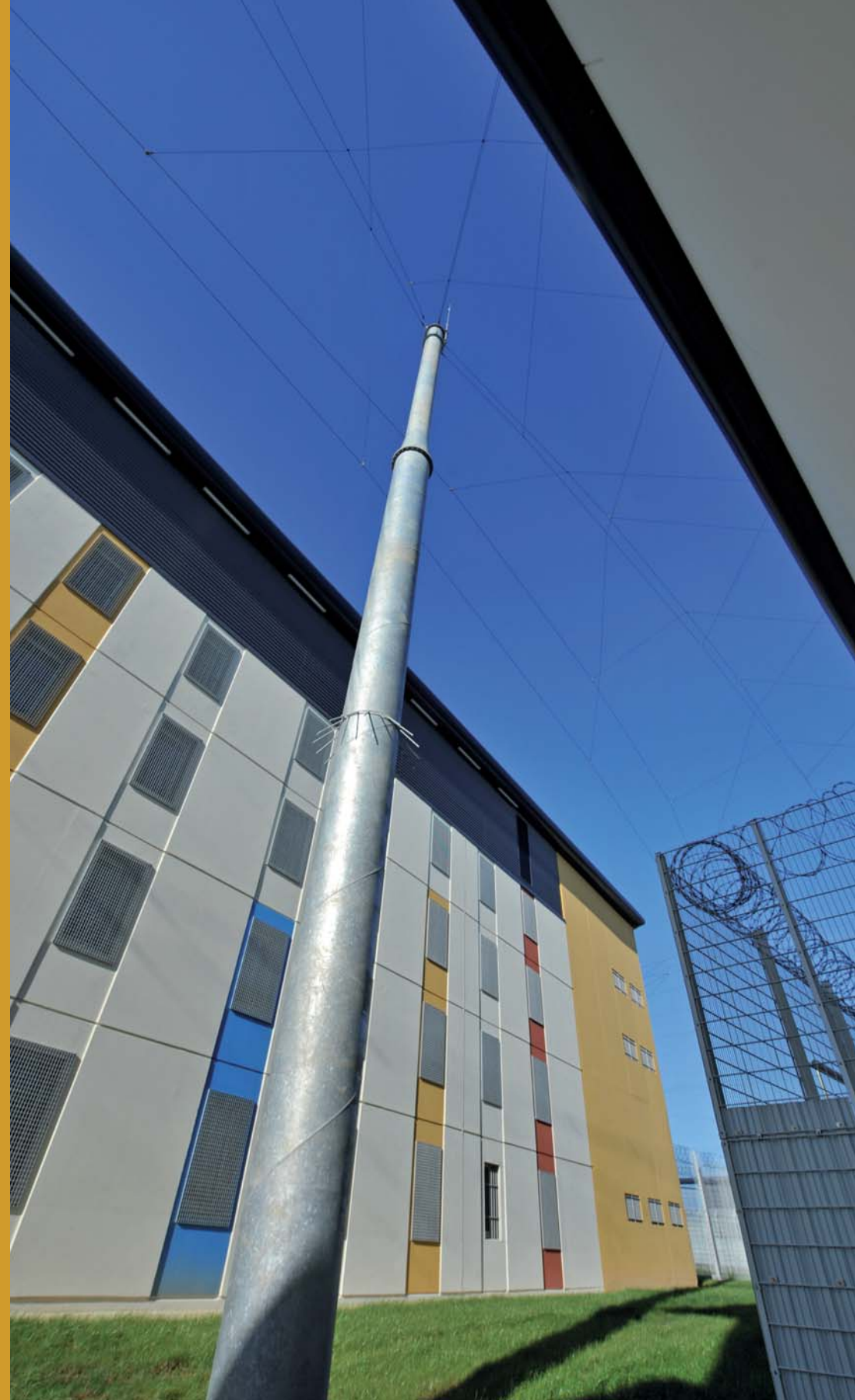
> Des mâts soutiennent les flins anti-hélicoptère qui couvrent toute la zone de détention.