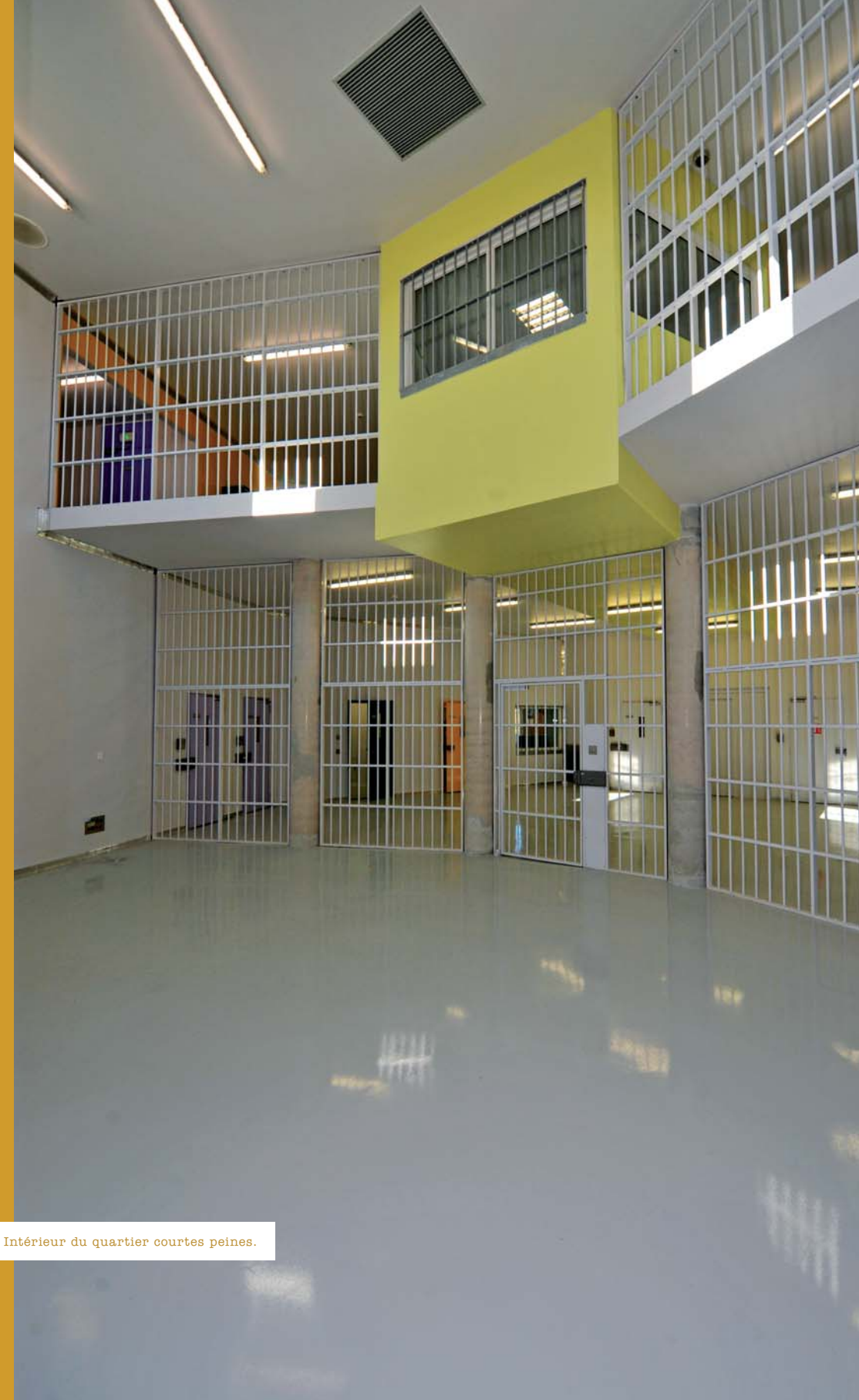
^ Intérieur du quartier courtes peines.

Le quartier d'hébergement des courtes peines (QCP) constitue une des innovations de la LOPJ de 2002