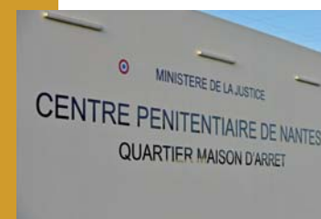
▲ Détail de la façade de l'établissement.

En associant les futurs utilisateurs des lieux, c'est toute une dynamique qui s'est mise en place favorisant une meilleure appropriation de l'établissement.