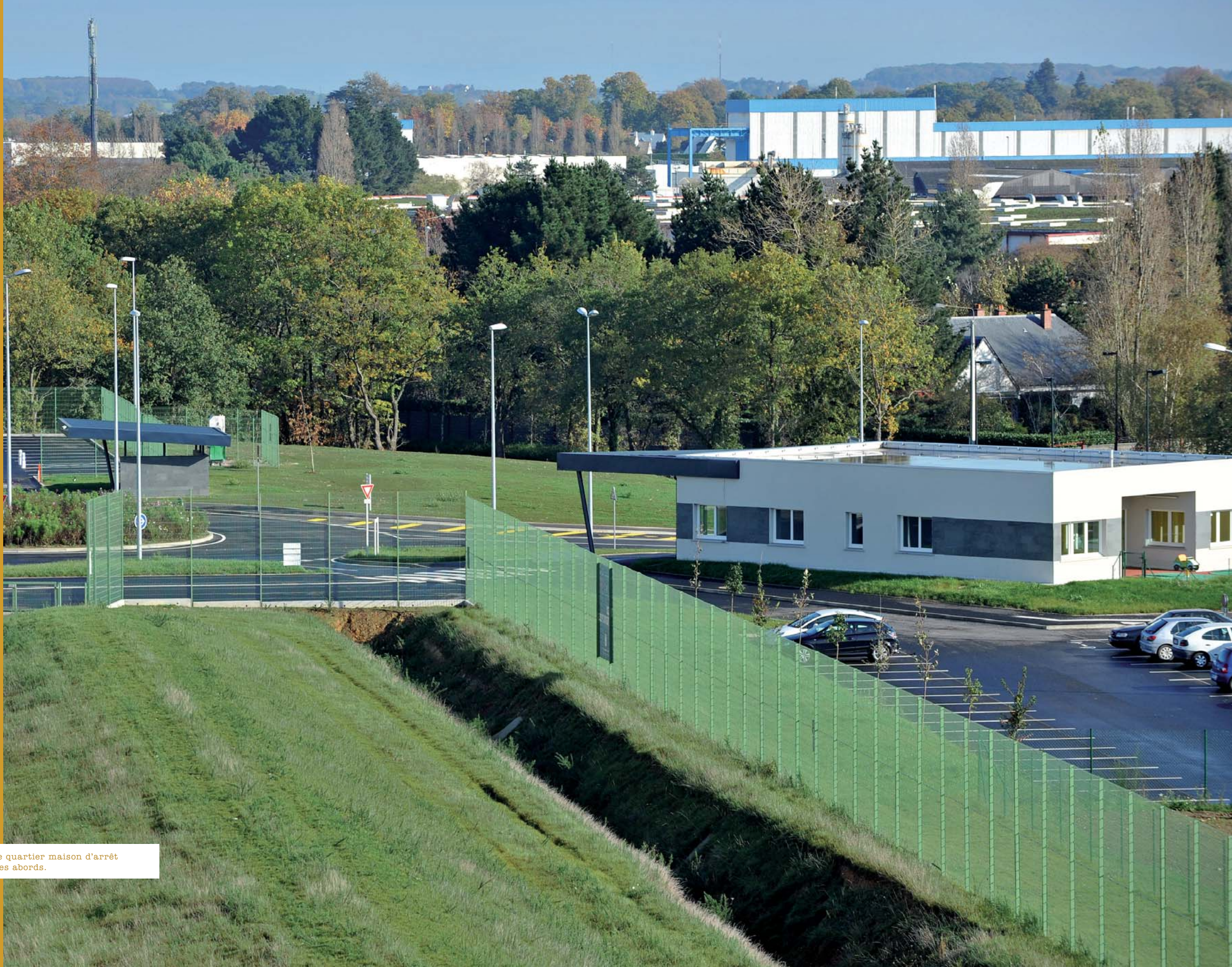
▲ Le quartier maison d'arrêt et ses abords.