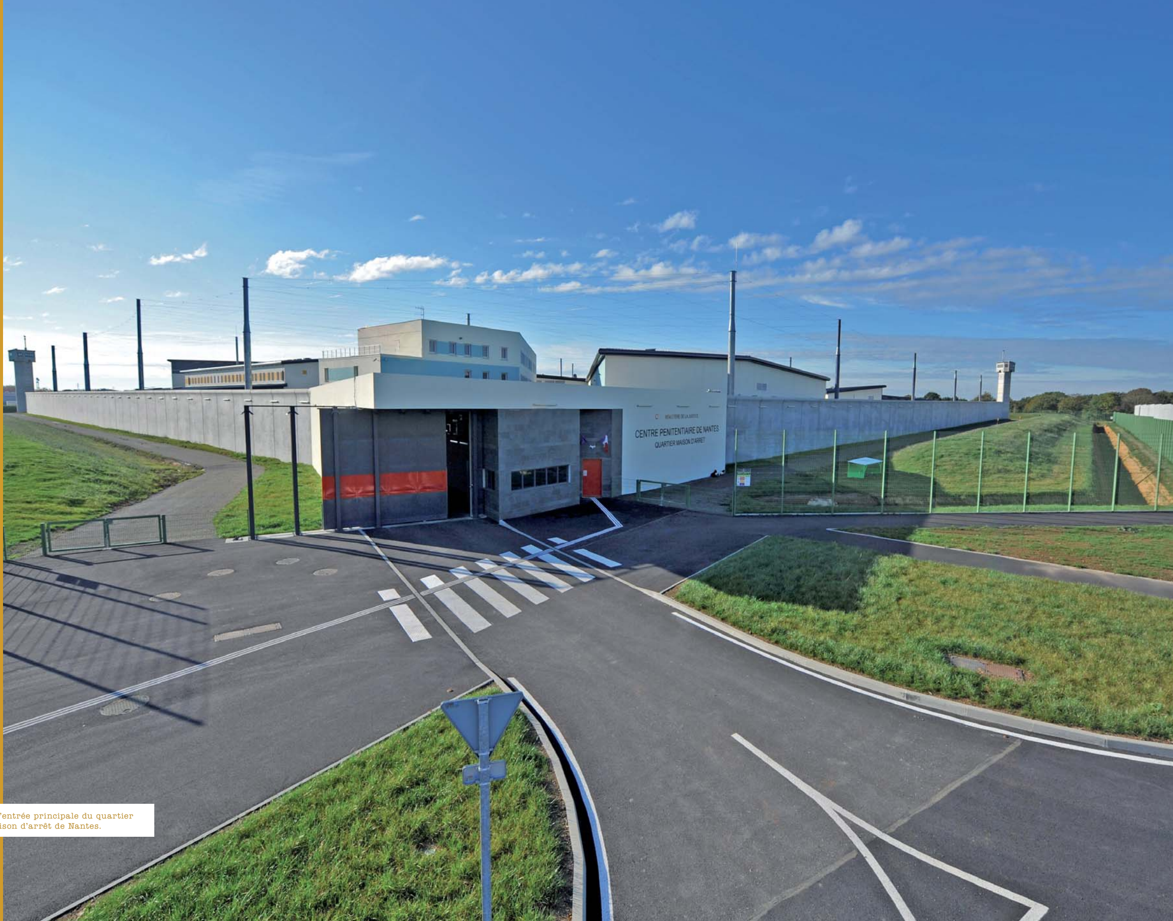
^ L'entrée principale du quartier maison d'arrêt de Nantes.