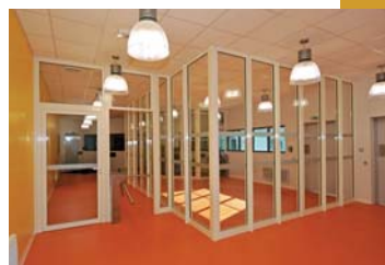
^ Sas visiteurs de la porte d'entrée principale (PEP).

La société de projet Théia, titulaire du contrat, fait appel pour son exécution à des entreprises chargées de la conception et de la construction ainsi qu'à des responsables