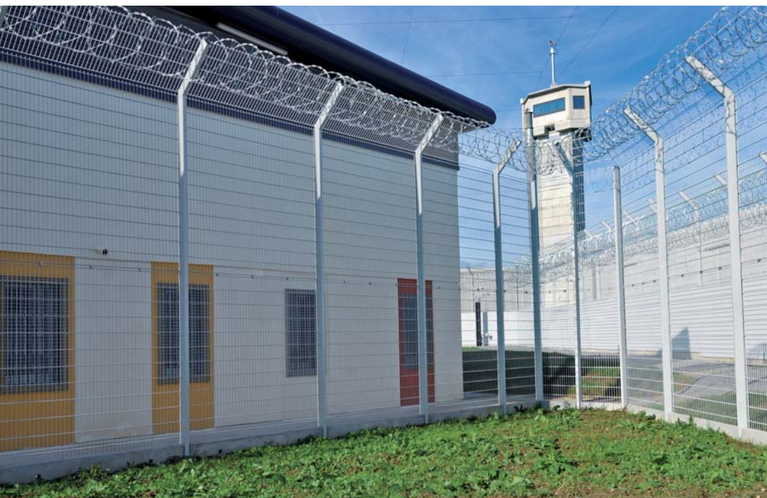
^ Végétalisation et jeux de couleurs sur les façades. ^ Le potager destiné à la culture dans le quartier des femmes.