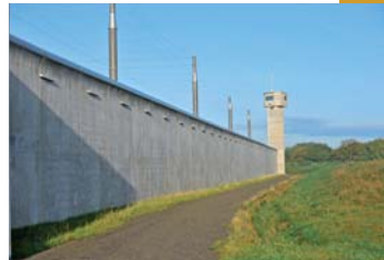
▲ Le mur d'enceinte.

Nous avons en effet dû construire des établissements qui fonctionneront de façon différente, avec des niveaux de sécurité variés. C'est à la fois plus compliqué, car ce sont des formes géométriques distinctes sur les trois sites, avec des problématiques propres de circulation des personnes détenues, mais cela nous a aussi donné plus de liberté. Ça nous a permis de dilater l'espace en maintenant la longueur de murs d'enceinte et de créer de petits coins qui forment autant de petites prisons. Cependant, c'est un même concept que l'on retrouve, avec toujours la présence des atriums à l'entrée des bâtiments d'hébergement, avec aussi la même attention portée aux espaces qui accueillent les familles et aux circulations spécifiques qui marquent la vie en détention. Comme toujours, il faut prévoir les différents circuits pour respecter le principe de non co-visibilité entre les hommes et les femmes, quand la prison est mixte, et entre les différents régimes de détention.