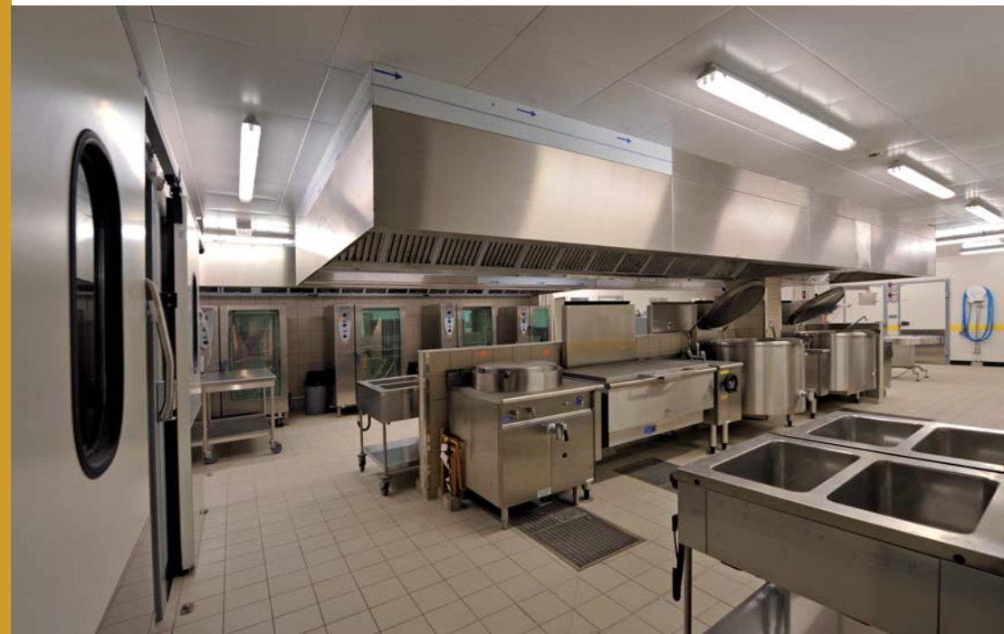
^ Le hall de l'unité socio-éducative. ^ La cuisine centrale de l'établissement où seront préparés 3000 repas par jour.