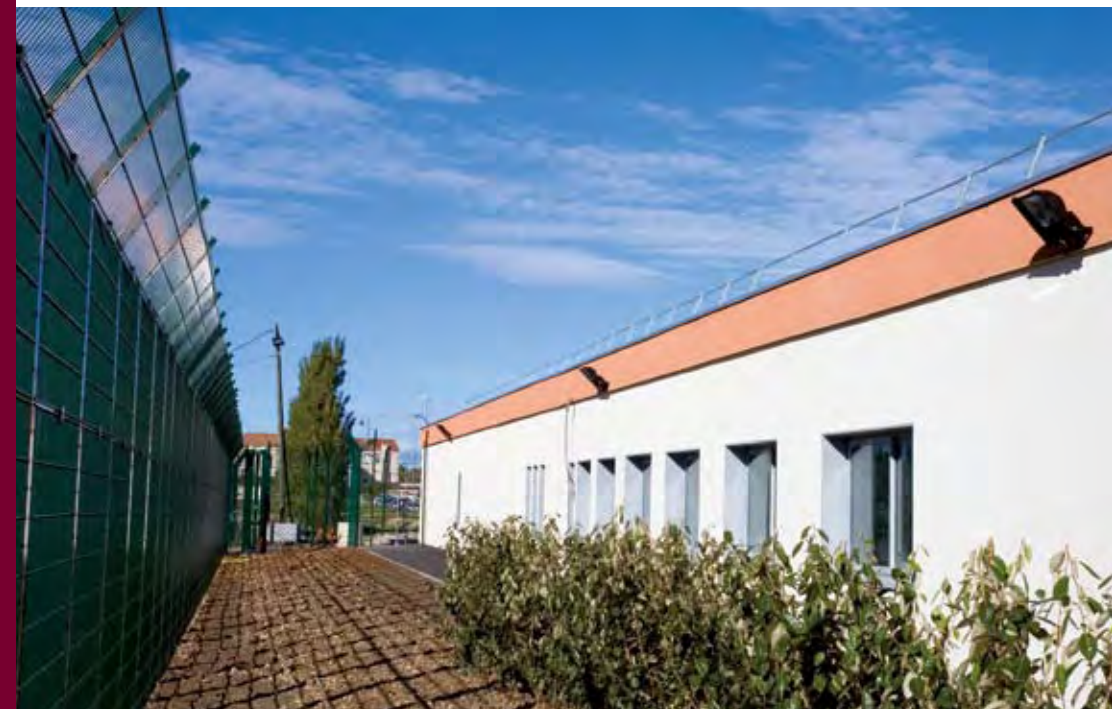
▲ Les abords du site.