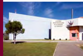
▼ Le centre pénitentiaire d'Avignon-Le Pontet à proximité.

À l'issue du concours d'architecture qui a permis de retenir le projet de l'agence grenobloise Chabal Architectes, la construction a fait l'objet de trois marchés différents.