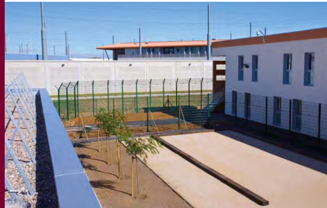
▲ La cour végétalisée est équipée d'un boulodrome et d'une table de ping-pong.

La cour de promenade a fait l'objet d'un traitement paysager . Conçue comme un jardin avec des arbustes, elle est équipée d'un boulodrome, d'une table de ping-pong et de bancs. Les détenus disposent de machines à laver et d'une salle commune où ils peuvent prendre s'ils le souhaitent leur plateau-repas. Le centre dispose également de bureaux d'audience, où les détenus peuvent s'entretenir avec les personnels de réinsertion, ainsi que d'une salle de sport.