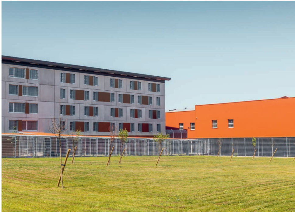
↑ Un des quartiers pour hommes (à gauche) et le bâtiment des services à la personne (à droite).

Construite entre 1899 et 1904, la maison d'arrêt de la rue du général Duparge à Caen connaît depuis plusieurs années des problématiques de vétusté de ses équipements et de sureffectif (elle a accueilli ces dernières années jusqu'à 480 personnes détenues pour 269 places). Avec 551 places en maison d'arrêt, le nouveau centre pénitentiaire qui ouvre ses portes à Ifs offrira non seulement une capacité d'accueil plus importante, mais aussi des installations modernes et variées. Avec tout d'abord une meilleure répartition des secteurs de détention réservés aux femmes, hommes et mineurs : « Le traitement de la non co-visibilité entre les trois publics détenus est beaucoup plus satisfaisant que dans l'ancienne maison d'arrêt, où le quartier des mineurs était situé au cœur du quartier des hommes », fait remarquer d'emblée Jean-Marie Landais, le directeur du centre pénitentiaire.