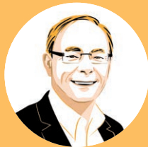
Bruno Hallé Architecte, Groupe 6