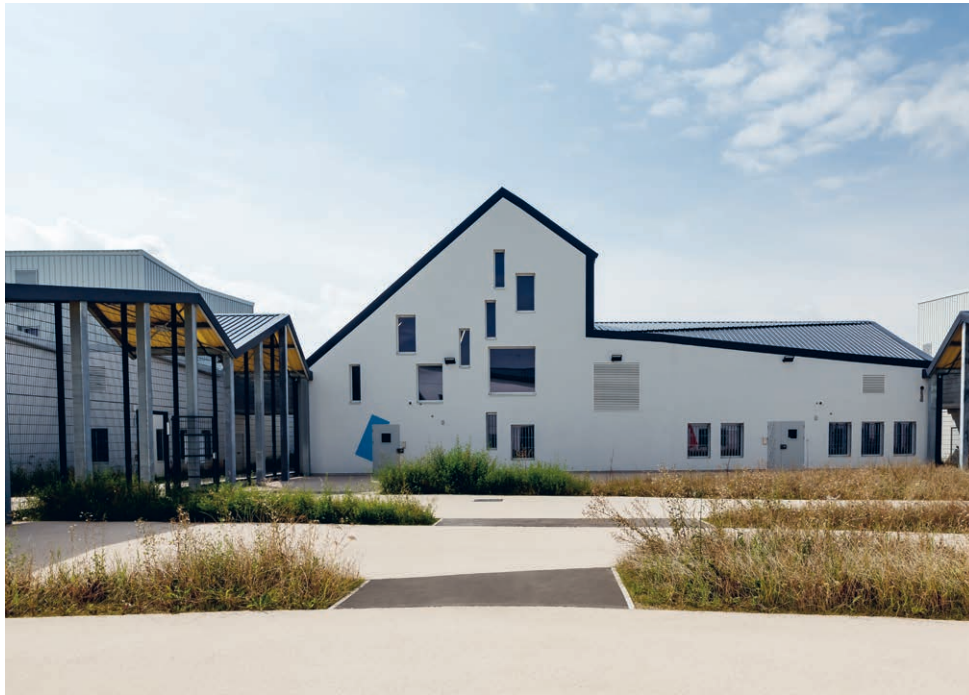
↑ La place végétalisée devant la salle de culte.