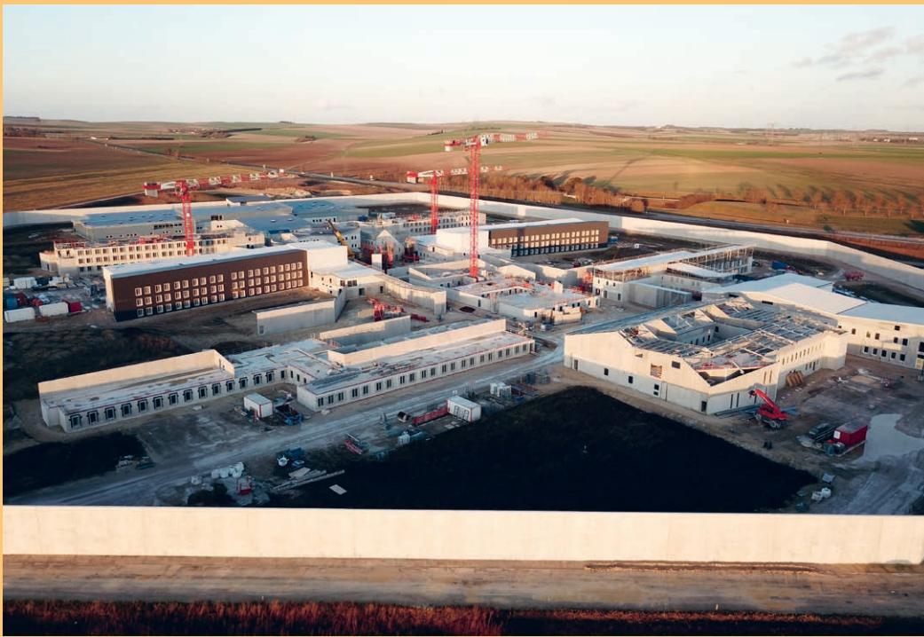
↑ → Vue générale du chantier en février 2022 (ci-dessus) et en septembre 2022 (ci-contre).

bloc central composé des locaux communs, les quatre quartiers de maison d'arrêt, qui sont répartis de part et d'autre du bloc central, la zone des ateliers, au fond, et les bâtiments hors enceinte, à savoir l'accueil des familles, le mess, les locaux du personnel hors enceinte et le nouveau pôle régional d'extraction judiciaire.